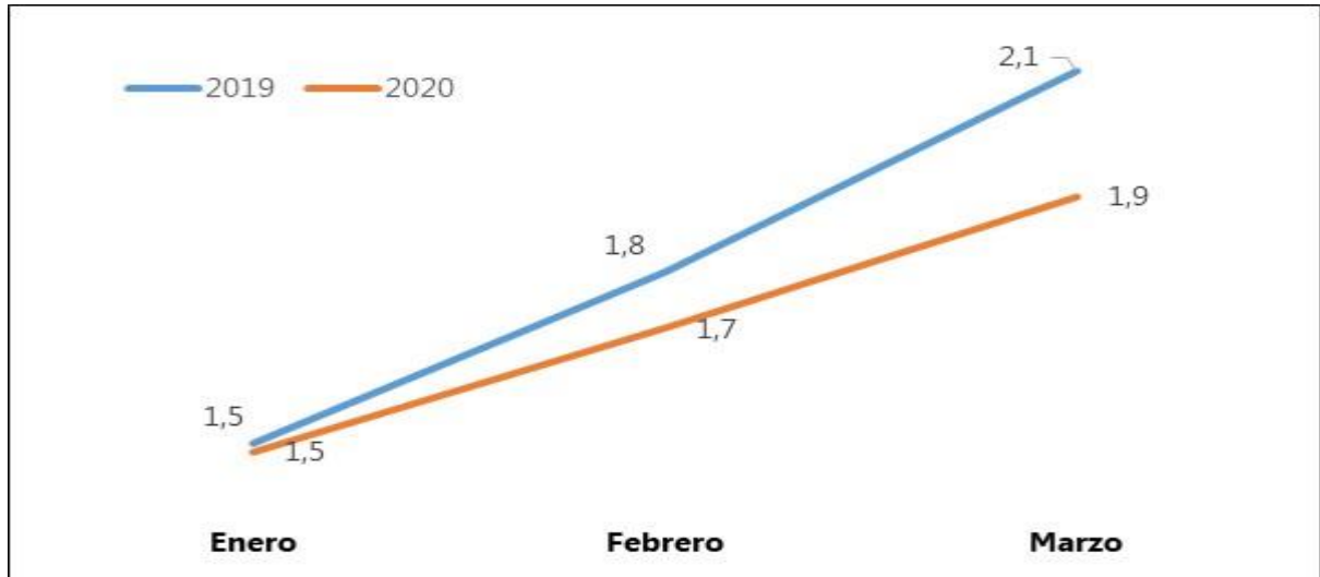
Gráfica 1: Evolución de la tasa de inflación general en el primer trimestre 2020 en comparación al mismo trimestre del año anterior (%).

Como se refleja en el gráfico la tendencia de la inflación en el primer trimestre de 2020 fue menos acentuada que durante el mismo periodo de 2019. Diferencia que se explica por el comportamiento de los precios medios del grupo “Productos alimenticios y bebidas no alcohólicas” que habían registrado una progresión de 2,0% en marzo de 2019, mientras que solo un aumento de 0,7% fue observado en marzo de 2020.